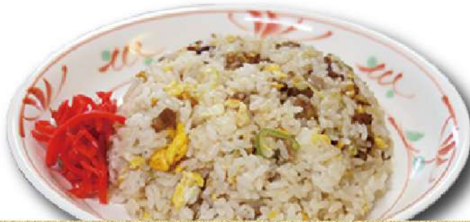
チャーハン スープ付き 820円