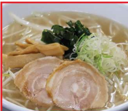
ラーメン 940円 半ラーメン 590円