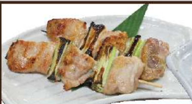
とり串 塩・たれ 390円