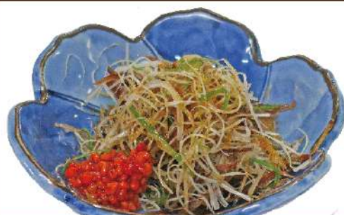
身欠きにしん 長葱和え 550円