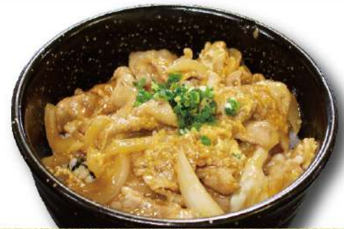
豚丼 味噌汁付き 900円