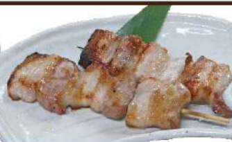
ブタ串 塩・たれ 390円