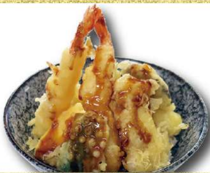
天井 味噌汁付き 980円