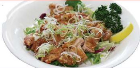
ユーリンチー 油淋鶏