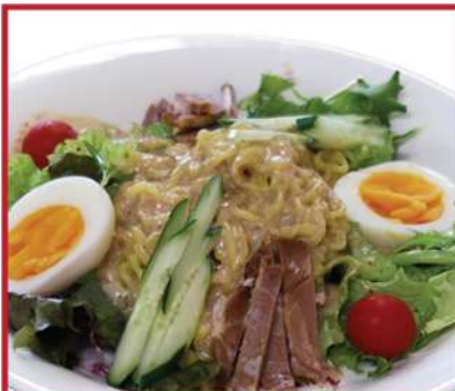
ラーメンサラダ 840円