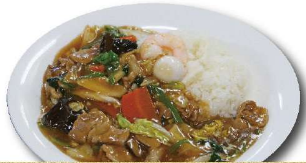
中華飯 スープ付き 920円