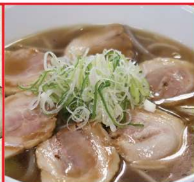
チャーシュー麺 1070円