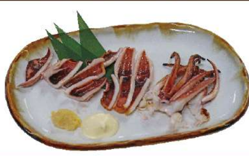
いかの一夜干し 1280円