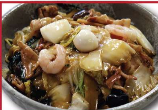
五目あんかけ焼きそば 920円