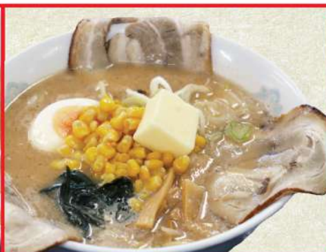
モエレラーメン 1190円