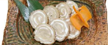
いぶりがっこ クリームチーズ 580円