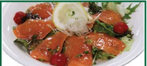
サーモンカルパッチョ