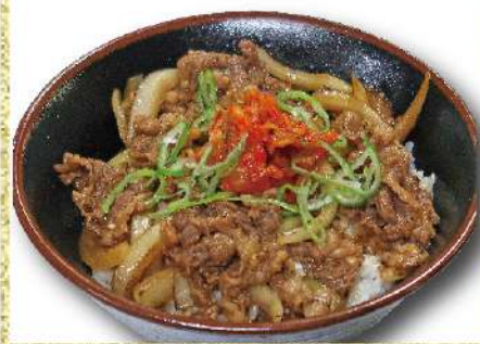
キムチ カルビ丼 味噌汁付き 990円